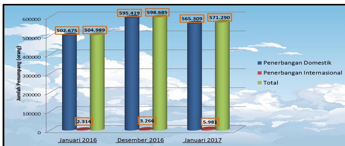
Gambar 1 Jumlah Penumpang Angkutan Udara di Kepulauan Riau Januari, Desember 2016, dan Januari 2017

Secara keseluruhan, jumlah penumpang angkutan udara baik domestik dan internasional mengalami penurunan sekitar 4,58 persen dari bulan sebelumnya. Sementara itu, jika dibandingkan dengan Januari 2016 terjadi kenaikan sebesar 13,13 persen, yaitu dari 504.989 orang menjadi 571.290 di Januari 2017.